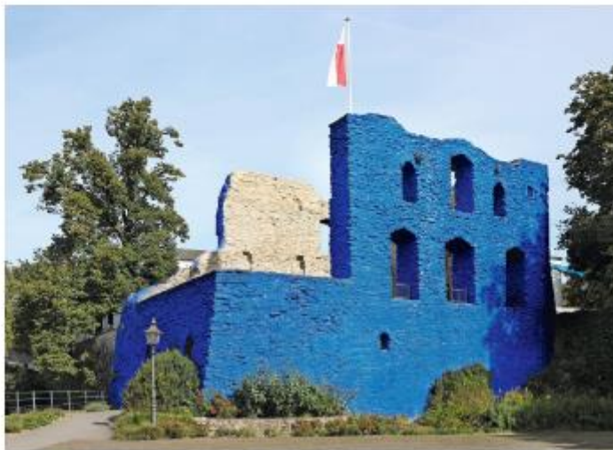
Über sieben Wochen umhüllte der blau pigmentierte Oberflächenschutz den Naturstein der Burgruine.

Die erstmals 1312 erwähnte Burg Bad Lippspringe wurde zum Gegenstand einer Kunstaktion. Der Umweltkünstler HA Schult stellte das zentrale Element Wasser in den Mittelpunkt seiner Aktion. Dabei wurde die Burgruine am Quellort der Lippe selbst zum Ausdrucksträger und für einen Zeitraum von sieben Wochen blau gefärbt. Es geht um Wasser als Quell allen organischen Lebens – ohne Wasser, ohne Flüssigkeit, verdorrt alles. Hitzequellen in diesem Sommer in Südeuropa potenzieren die politische Aktualität dieses Projekts. Daher der intensive Farbton Ultramarinblau.